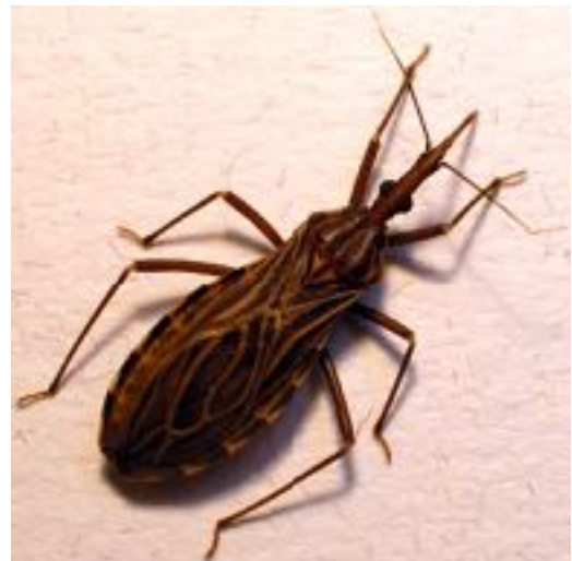
figuur 5: De roofwants die de ziekte van Chagas overbrengt

Als we het één bij het ander voegen, krijgen we een aardig beeld van hoe dat kan zijn gegaan. De eencellige Trypanosoma cruzi zou oorspronkelijk in een mutualistische symbiose met de wants kunnen hebben geleefd - waarbij de eiwitjas een noodzakelijk attribuut was om te voorkomen dat de eencellige zou worden verwijderd door het immuunsysteem. De wants was oorspronkelijk een plantensap-zuiger. Ontwikkeling naar bloedzuiger voor de wants zorgde ervoor dat Trypanosoma cruzi in een ander milieu