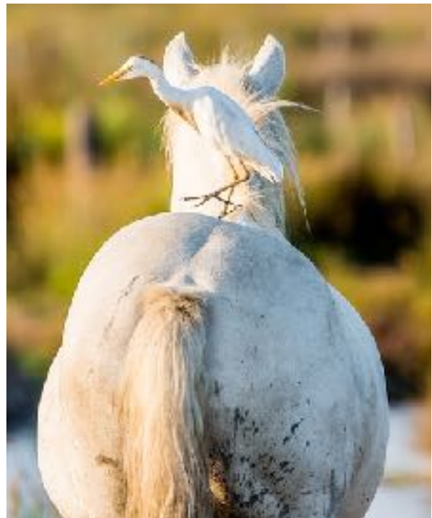
figuur 1: Een koereiger op een paardenrug

commensalisme : het ene organisme leeft op de ander (en heeft daar voordeel van), zonder de ander te benadelen. Bacteriën op onze huid worden wel commensalen genoemd (en ook daarvan is bekend dat ze ons ziek kunnen maken als ze door een wondje ons lichaam binnenkomen). Parasitisme is de derde vorm: hierbij heeft de