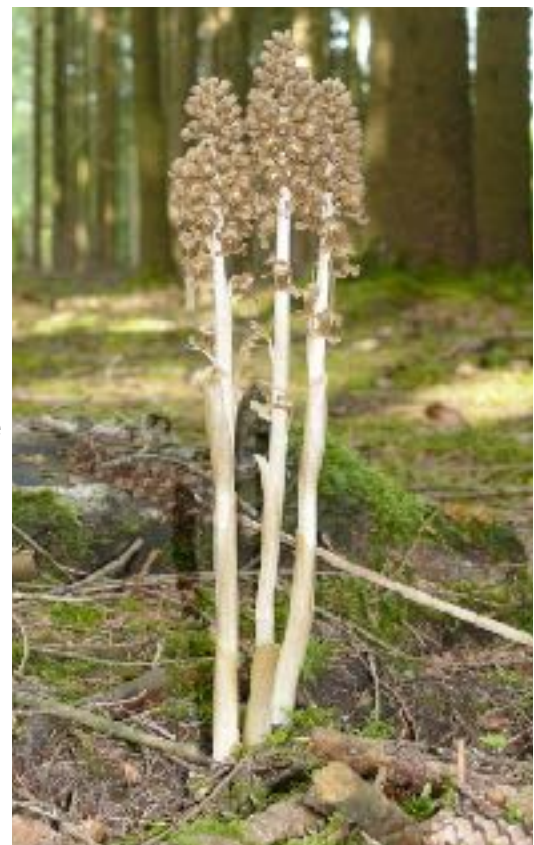
figuur 3: De epi-parasiet Vogelnestje